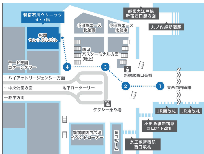
新宿西口地下コンコースマップ